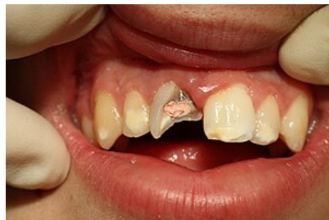
Částečně ošetřená zlomenina korunky horního řezáku.